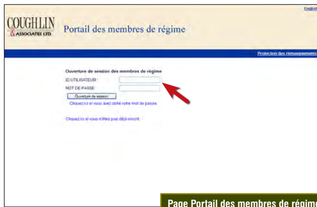
Page Portail des membres de régime

Après avoir accédé au portail, un menu de choix s'affiche.