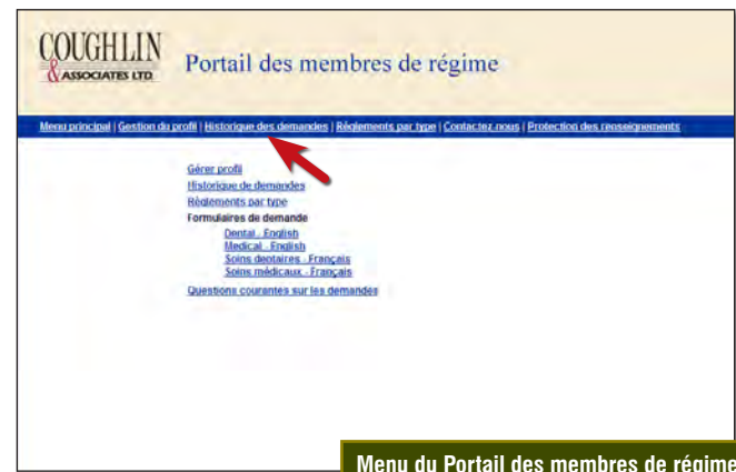
Menu du Portail des membres de régime

Cliquez sur « Historique de demandes » pour voir le statut de traitement des demandes présentées récemment. La liste des activités s'affiche. Le dépôt est également confirmé par courriel.