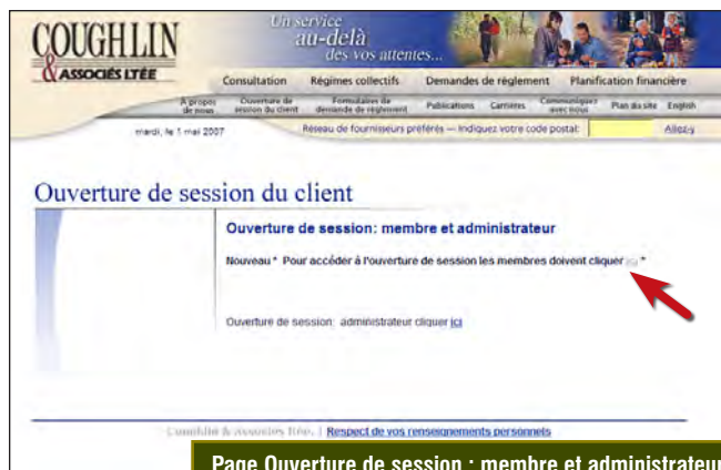
Page Ouverture de session : membre et administrateur

L'utilisation du portail est facile. Il vous suffit de saisir votre numéro d'identification personnelle et votre mot de passe. (Note : La première fois qu'un membre utilise ce service, il doit également fournir le numéro de son régime. Les membres qui ne connaissent pas le numéro de leur régime ou leur numéro d'identification personnelle sont priés de communiquer avec leur service de ressources humaines ou le gestionnaire du portail à l'adresse portal@coughlin.ca . Le membre recevra un mot de passe temporaire qu'il devra remplacer par son propre mot de passe permanent la première fois qu'il accède au portail.)